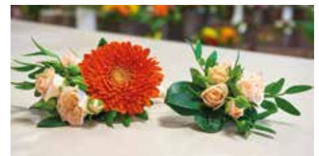
Anstecker für Bräutigam und Trauzeugen