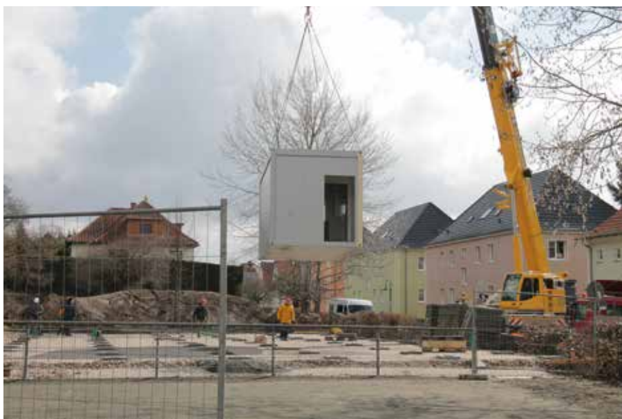
Die Einzelteile der drei Klassenzimmer samt Sanitäranlagen schwebten Ende März in der Poststraße ein.

Der Brandiser Bildungscampus mit Grundschule, Oberschule und Gymnasium genießt ein sehr hohes Ansehen und prägt damit auch den Ruf der Stadt. Dementsprechend ist er bei Schülerinnen und Schülern als Lernort gefragt. „Dem müssen wir Rechnung tragen und uns eben mit Interimslösungen behelfen“, so Jesse. Denn perspektivisch hat sich der Stadtrat bereits im Juni 2019 in einem Grundsatzbeschluss für eine mittel- und langfristige Entwicklung des Campus' samt Erweiterungsbauten ausgesprochen. Oberstes Ziel ist dabei die qualitative Absicherung der 4,5-zügigen Beschulung der weiterführenden Schulen. Ein Förderantrag ist längst gestellt, ob aber überhaupt in den nächsten Jahren im Freistaat Fördergelder für Schulhausbau zur Verfügung stehen, ist jedoch nach letzten Informationen sehr fraglich. „Natürlich können wir solche Projekte ohne Förde-