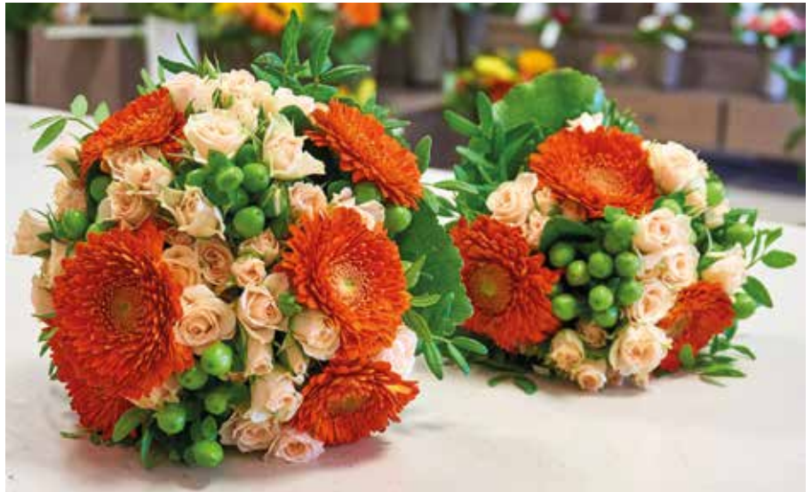
Brautstrauß und Wurfstrauß