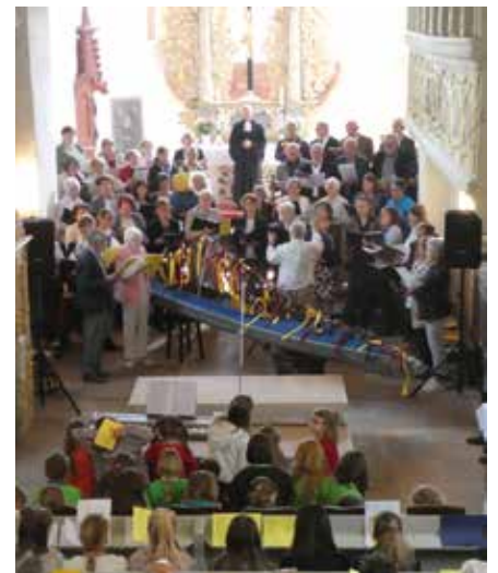
Regionaler Gottesdienst 2019 in Brandis.