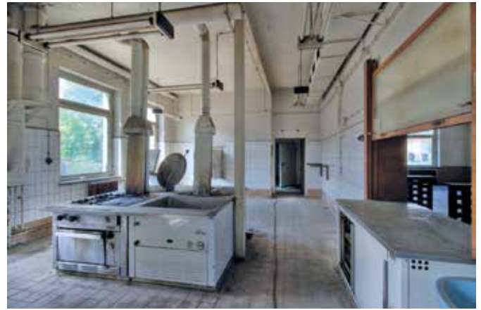
Die Küche des Kulturhauses Beucha bot Abo-Essen für die Betriebe des Ortes an. (Fotograf: Alexander Kirchner, 2018)

Saal mit Bühne, in dem regelmäßig Kinovorführungen stattfanden. Hier wechselten sich in den folgenden Jahren eine Vielzahl von Kulturveranstaltungen wie Konzerte, Festlichkeiten, Ausstellungen, Tanzveranstaltungen und Filmvorführungen ab. Der schon seit 1960 hier tätige