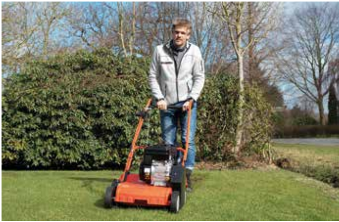
Der Vertikutierer befreit den Rasen von unerwünschtem Wildwuchs, die Gräser können wieder befreit aufatmen.