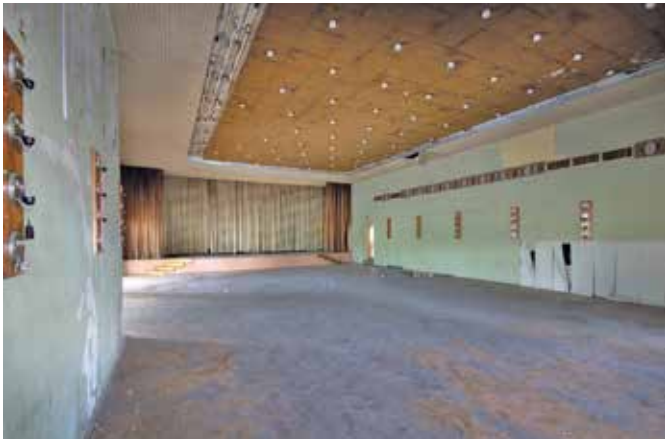
Der Festsaal des Kulturhauses Beucha.