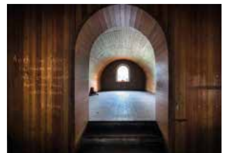
Das „Fass“, einem Gewölbekeller nachempfundenem Weinabteil.

Von nun an war das Restaurant „Feldschlößchen“ das „Kulturhaus Beucha“. In der unteren Etage befanden sich das beliebte „Fass“, ein in einem Gewölbekeller nachempfundenem Wein- und Gastraum, ein Café mit Terrasse, eine moderne Küche und die Gaststube. In der Woche bot