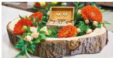
Floral ausgeschmücktes Ringkissen