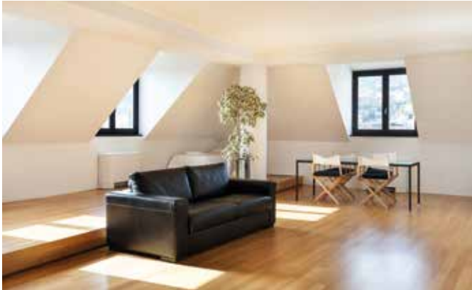
Das Wohnen im Dachgeschoss hat seinen besonderen Charme. Die wichtigste Voraussetzung ist die fachgerechte Ausführung der mehrschichtigen Dachkonstruktion.

Immer mehr Eigenheimbesitzer entscheiden sich dafür, den Dachboden zu nutzen, um zusätzliche Wohnfläche zu schaffen. Ein Dachausbau – oft in Verbindung mit einer Steildachsanierung durchgeführt – bringt viele Vorteile. Denn nicht nur der Wohnraum vergrößert sich, auch die Energieeffizienz des Hauses wird besser und der Wert des Eigenheims steigt. Eigentümer, die sich für den Ausbau eines älteren Dachgeschosses entscheiden, sollten die Gelegenheit nutzen und gleichzeitig auch die Dämmung erneuern. Eine moderne Dämmung schützt das Dachgeschoss im Winter vor Kälte und im Sommer vor Überhitzung. Um in vollem Umfang vom Wärmeschutz einer