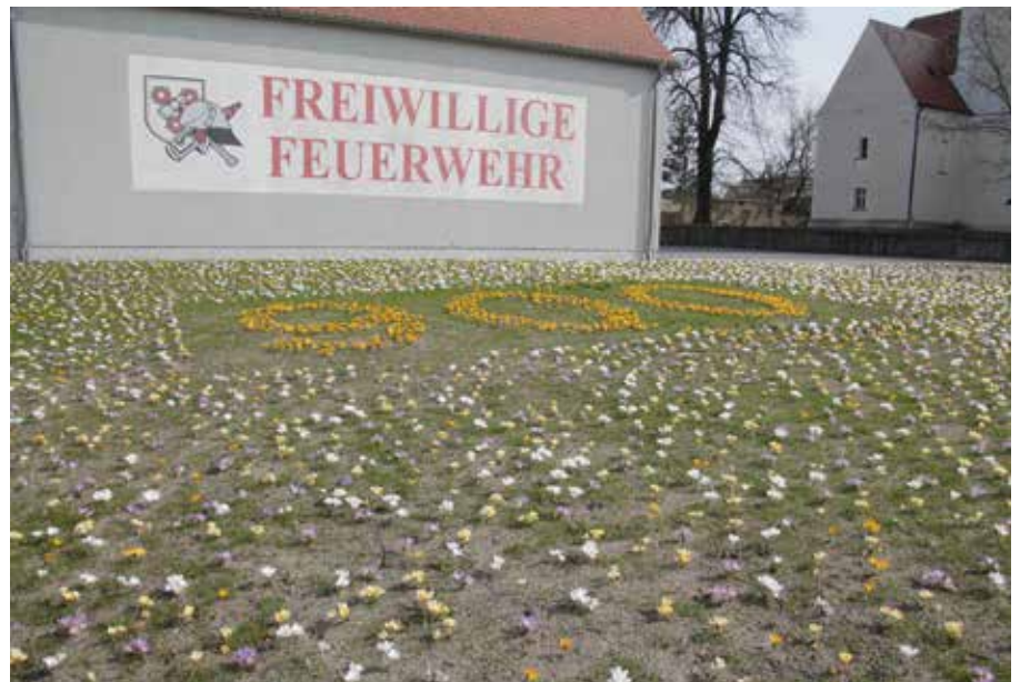
Auf der Wiese sind ca. 7.000 Krokus-Zwiebeln gesteckt worden, um die Frühlingswiese mit der 900 entstehen zu lassen.

Etwa 500 Pflanzen zieren jetzt auch das Rondell im Stadtpark. Die Bauhof-Mitarbeiter Guido Baaske und Ronny Meißner befreiten das Rondell von Unkraut und Wildwuchs, bevor sie die verschiedenfarbi-