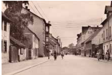
Die Brandiser Hauptstraße im Jahr 1961.