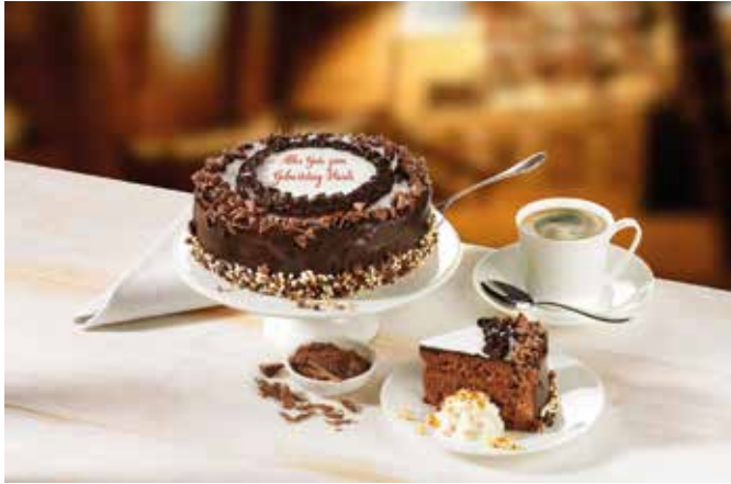
Eine süße und gleichzeitig persönliche Botschaft: Die Schokoladentorte mit individueller Beschriftung sorgt für Glücksmomente.

„Mama ist die Beste“ – über diese Botschaft freut sich jede Mutter und Großmutter. Und wenn der Dank der Kinder obendrein in Form einer individuell beschrifteten Schokotorte überbracht wird, dürfte so manche Freudenträne fließen. Zum jährlichen Festtag aller Mütter am 9. Mai, aber auch zu anderen Anlässen wie Mamas oder Omas Geburtstag ist Originalität gefragt. Ein Parfüm oder ein Buch verschenken, das kann schließlich jeder. Gefragt sind stattdessen Präsente mit besonderer Note, die lange in Erinnerung bleiben und beispielsweise für genussvolle Momente sorgen – so wie eine Torte mit persönlicher Beschriftung.