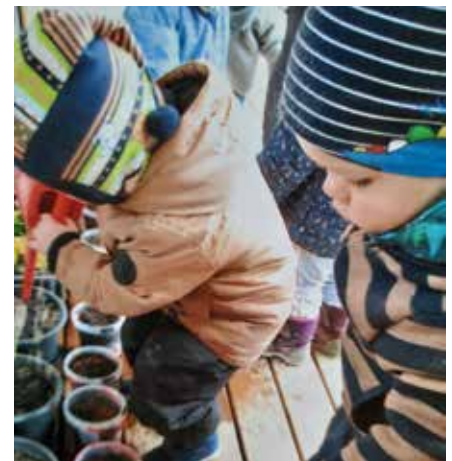
Die selbst gesäte Kresse wurde fleißig gegossen.