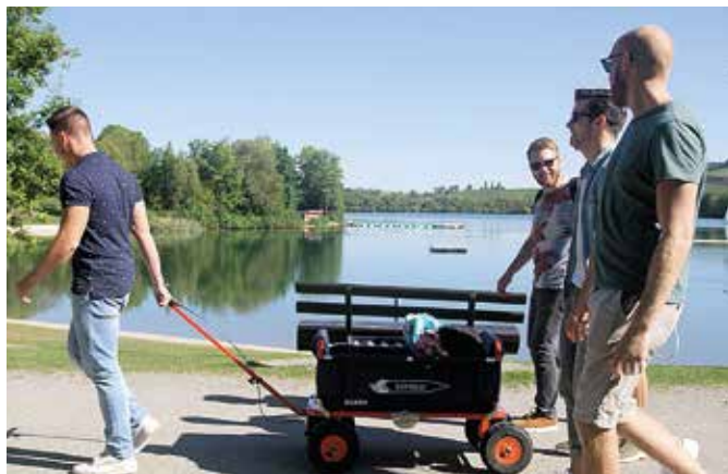
Männertour zum See? Der Express-Falt-Bollerwagen ist mit dabei.

Für ein Picknick am See oder bei der Vatertagswanderung genügt häufig ein Basismodell. Heutzutage sind Bollerwagen idealerweise mit einer Fahrradzugstange nachrüstbar, sodass sie auch an ein Fahrrad angehängt werden können. Praktisch ist weiterhin ein Planendach, das den Proviant vor kleinen Regenschauern oder starker Sonneneinstrahlung schützt. Zur nächsten Stufe gehören dann Wagenmodelle aus robustem Stoff mit stabilen Querstreben, die man ohne Werkzeug zusammenfalten oder auseinandernehmen kann. Sie sind leicht, passen in fast jeden Kofferraum und nehmen nach dem Ausflug nicht viel Lagerplatz in der Garage weg. Der Eckla Express Faltbollerwagen beispielsweise wird in drei verschiedenen Farbkombinationen angeboten. Zudem ist er mit einer längenverstellbaren Deichsel ausgestattet, sodass kleine und große Menschen ihn bequem ziehen können. Beim Kauf eines Boller- oder Transportwagens sollte darauf geachtet werden, dass er nicht nur über eine Feststellbremse verfügt, sondern auch über eine Betriebsbremse. Erstere sichert das Gefährt im Stand gegen ungewolltes Wegrollen. Letztere wird wie eine Handbremse während der Fahrt benutzt. Sie ist gerade in bergigen Regionen von Vorteil.