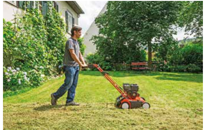
Mit einer regelmäßigen Pflege kommen Freizeitgärtner ihrem Ziel näher: einem dichten und gesunden Rasen.

sollten Sie zusätzlich wässern. Dabei gilt die Devise: nicht zu oft, aber wenn, dann richtig. Selbst bei anhaltender Trockenheit genügt es, die Rasenfläche einmal pro Woche zu sprengen.