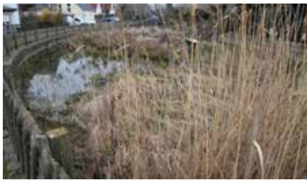
Der Löschteich in Polenitz führt schon seit längerem nicht mehr ausreichend Wasser. Dem soll durch den Einbau einer Zisterne in den Teich Abhilfe geschaffen werden.

„Wie beim Erstellen des vorherigen Doppelhaushaltes werden wir die Brandiser Bürgerinnen und Bürger bei der Findung der Prioritäten einbeziehen – das ist nicht selbstverständlich, soll für mehr Transparenz sorgen und hilft uns, Schwerpunkte richtig zu setzen“, erklärt Jesse. So kann die Bevölkerung zeigen, welche Projekte ihnen am Herzen liegen. Deshalb ruft Jesse auf: „Stimmen Sie ab und helfen Sie den Stadträten bei der Entscheidungsfindung mit!“