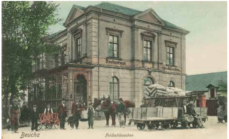
Postkartenmotiv Feldschlößchen, 1920

Nach dem Zweiten Weltkrieg änderten sich die Besitzverhältnisse, die HO (Handelsorganisation) übernahm das Feldschlößchen und das Obergeschoß wurde weiter als Kino genutzt. 1959 fanden die ersten Umbauten statt. Im vorderen Teil der Scheune entstand ein Waschstützpunkt und hinter der Scheune wurde eine Garagenanlage errichtet. Der Pferdestall im hinteren Teil des Hofes wurde zur Wohnung des Hausmeisters. 1962/63 erfolgte der Umbau der ehemaligen Scheune zum Feuerwehrgerätehaus der Freiwilligen Feuerwehr Beucha. Anfang 1970 gab es dann Überlegungen für größere Veränderungen. Im Jahre 1973 war Baubeginn. Die Betriebe des Ortes übernahmen Leistungen und Arbeiten, um dieses Gemeinschaftsprojekt fertig zu stellen. 1976 konnte dann bei einer eindrucksvollen Einweihung die Fertigstellung gefeiert werden.