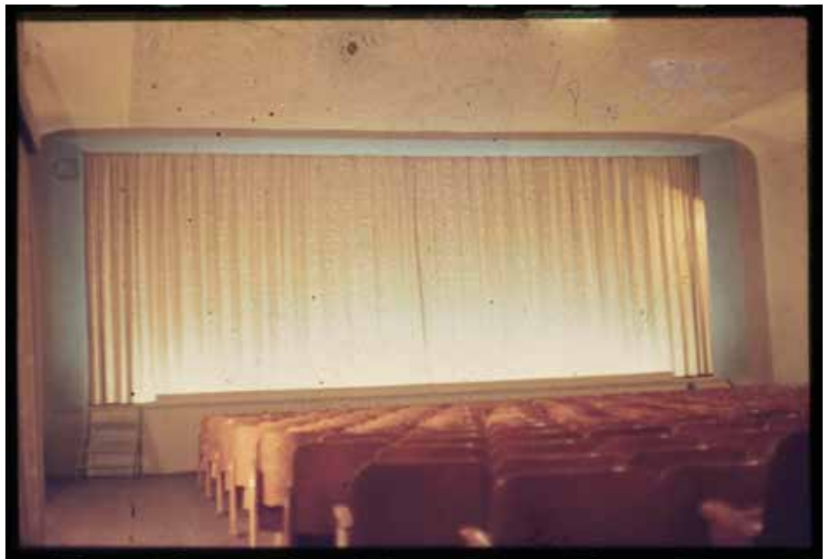
Kinodia vom Saal mit Bestuhlung vor dem Umbau, 1972

Von nun an war das Restaurant „Feldschlößchen“ das „Kulturhaus Beucha“. In der unteren Etage befanden sich das beliebte „Fass“, ein in einem Gewölbekeller nachempfundenem Wein- und Gastraum, ein Café mit Terrasse, eine moderne Küche und die Gaststube. In der Woche bot