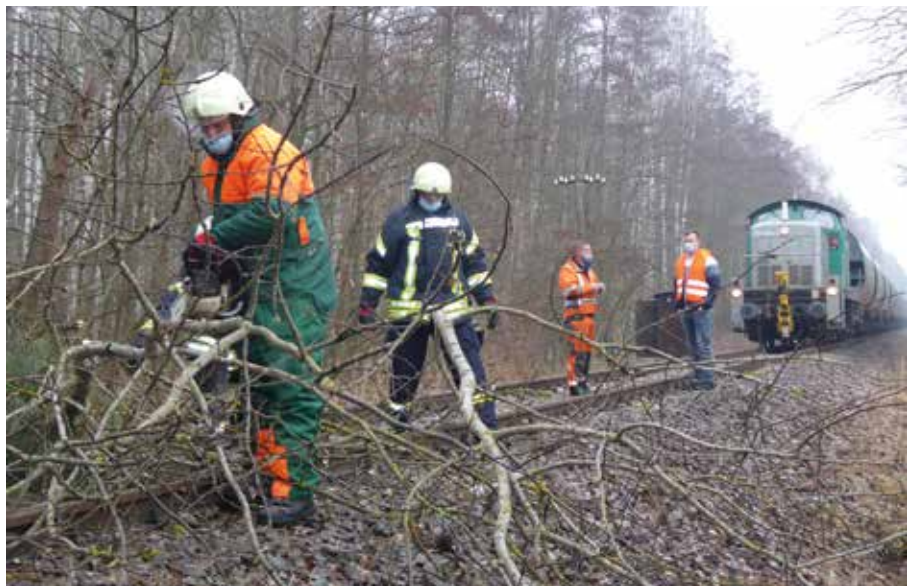
Die Kameraden entfernen einen Ast von den Gleisen.

Mit steigenden Temperaturen nahmen auch unsere Einsatzzahlen zu. Im März mussten wir insgesamt zehn Mal ausrücken. Den ersten Einsatz hatten wir bereits am 2. Tag des letzten Monats, am frühem Morgen. Auf der Bundesautobahn 14 war ein Pkw in die Leitplanke gefahren, so dass wir die Einsatzstelle absicherten und den Brandschutz sicherstellten. Am späten Nachmittag des gleichen Tages ging es dann in die Asylunterkunft nach Waldsteinberg. In der Küche hatte ein Brandmelder ausgelöst. Nach erfolgter Kontrolle gab es für die Ortsfeuerwehren nichts weiter zu tun. Am 13. März rückte unser LF 10 und unsere Drehleiter zu einem umgestürzten Baum aus, der in einer Telefonleitung hing. Fünf Tage später mussten wir vormittags einen Baum von den Bahngleisen nach Trebsen entfernen. Der Lokführer hatte glücklicherweise die Gefahr rechtzeitig bemerkt und seinen Güterzug vorher zum Stehen gebracht. Am gleichen Tag abends galt es an einer Laderampe ausgelaufenes Hydrauliköl aufzunehmen. Am nächsten Vormittag beschäftigte uns wieder das Thema Ölspur. Aufgrund der Länge beseitigte diese die Firma Topcar. Am 25. März leistete unsere Drehleiter auf Anforderung des Bennewitzer Bürgermeisters Amtshilfe in Zeititz und beseitigte einen großen abgebrochenen Ast, der auf die Fahrbahn zu fallen drohte. Die letzten drei Tage des Monats hatten wir jeweils einen Einsatz. Am 27. März fuhr abends ein Motorrad in einem Straßen-graben. Wir übergaben den leichtverletzten Fahrer dem durch uns angeforderten