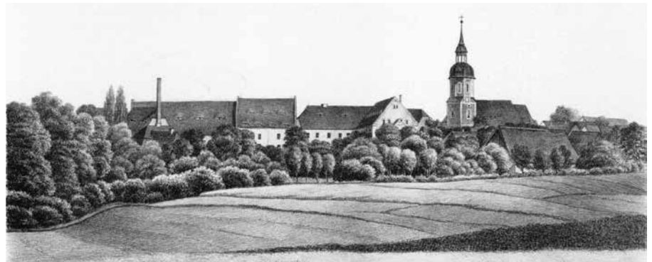
So sah der Kirchturm vor seinem Abriss aus. Quelle: G. A. Pönicke: „Album der sächsischen Rittergüter und Schlösser“, I. Section Leipziger Kreis, Leipzig 1860

Dieser Turm prägte den Ort und die Umgebung für 245 Jahre und ist fest mit deren Historie verankert. Im Moment sichten die Mitglieder des neu gegründeten Förderverein Dorfgemeinschaft Polenz e. V. dazu historische Nachweise und tauschen sich mit Polenzerinnen und Polenzerern über die Geschichte des wunderschönen Kirchgebäudes aus. Darüber hinaus sind sich die Beteiligten jedoch felsenfest sicher, dass die Rekonstruktion des Turmaufbaus der Kirche zu Polenz auch die gesamte umliegende Region kulturell und historisch bereichern wird. Nun sind alle Mitglieder des neu gegründeten