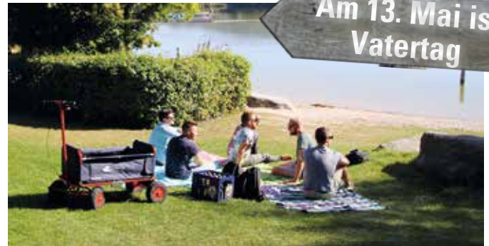
Ein Bollerwagen ist ein praktischer Helfer für den Transport von Getränkeboxen, Proviant und Decken.