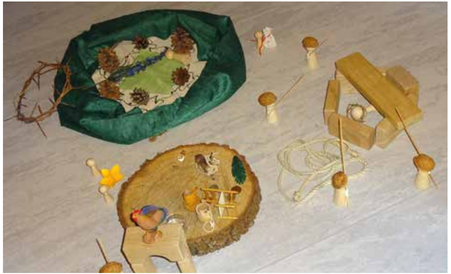
Die einzelnen Begebenheiten des Osterwegs.

Während die Kinderstubenkinder bei den gruppenweise abwechselnden Waldgrundstückbesuchen vor ein paar Wochen noch über die ersten Frühblüher, in all ihren Variationen, staunen konnten, entdecken sie nun fast täglich neue Blütenformen und -farben, welche es natürlich gemeinsam zu benennen gilt. Ich als Mama staune, wie viel Wissen mein Sohn mir da gekonnt und begeistert weitergibt und freue mich über seine zunehmende Achtsamkeit, was die Pflanzen und Tiere um uns herum betrifft. „Mama, wenn wir im Wald so laut sind, stören wir die Vögel vielleicht dabei, ihren Partner zu finden, weil sie dann erschrecken könnten.“ Auf das Themengebiet „die Vögel in unserer Umgebung“ wurde kürzlich ein besonderes Augenmerk gelegt. Mit dem Projekt „Vogelhausbau“ waren die einzelnen Gruppen ganz tatkräftig dabei, dem Frühling etwas auf die Sprünge zu hel-