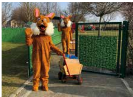
Die Osterhasen versteckten im Garten des Knirpsentreffs Osternester.

Bei wunderschönem Frühlingswetter und blauem Himmel konnten wir auch dieses Jahr die Osterhasen wieder bei uns im „Knirpsentreff“ begrüßen.