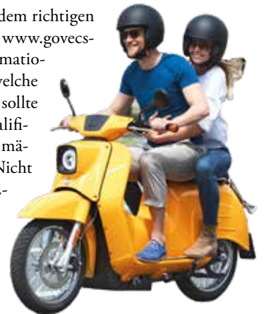
Helm auf und los: Viele Roller gibt es mittlerweile auch als umweltfreundliche E-Fahrzeuge.

Gleichzeitig muss die Frage nach dem richtigen Führerschein geklärt sein. Unter www.govecs-scooter.com stehen genaue Informationen zur Verfügung, wer wann welche Klasse fahren darf. Nicht zuletzt sollte der Rollerfahrer wissen, wo es qualifizierte Anlaufpunkte für den regelmäßig notwendigen Service gibt. Nicht jede Rollerwerkstatt darf auch E-Roller warten und reparieren, hierzu muss eine spezielle Ausbildung vorhanden sein.