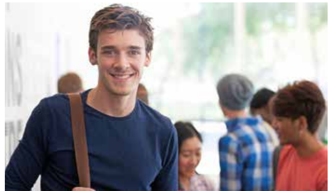
Wie geht es nach der Schule weiter? Darüber informieren sich junge Erwachsene auch virtuell.